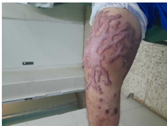
Panel B: Se observan las lesiones, en la vista anterior del miembro inferior derecho.

Recibido: 24-10-25 Aceptado: 13-11-25 Publicado: 07-02-26