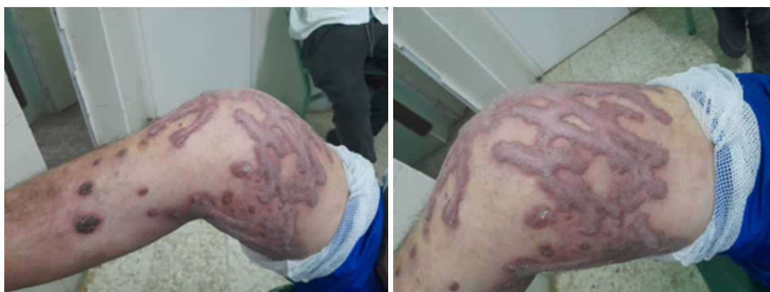
Panel A: Se observan las lesiones del liquen plano hipertrófico, en el miembro inferior derecho, vista medial (muestra el costado interno del muslo y pierna).

Se trata de un paciente de 47 años de edad, con antecedentes de salud aparente, comienza con lesiones pruriginosas en miembros inferiores que evolucionan a lesiones hiperqueratósicas, a pesar del tratamiento inicial con cremas esteroideas y antiinflamatorios por vía oral. Se decide la realización de biopsia y se obtiene como resultado el diagnóstico del liquen plano hipertrófico.